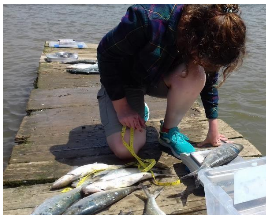
Figure 4. Suivi scientifique des espèces de poissons diadromes. Sur la photo de gauche, la télémétrie acoustique est utilisée pour suivre une truite. Sur la photo de droite, une alose est pesée et mesurée.