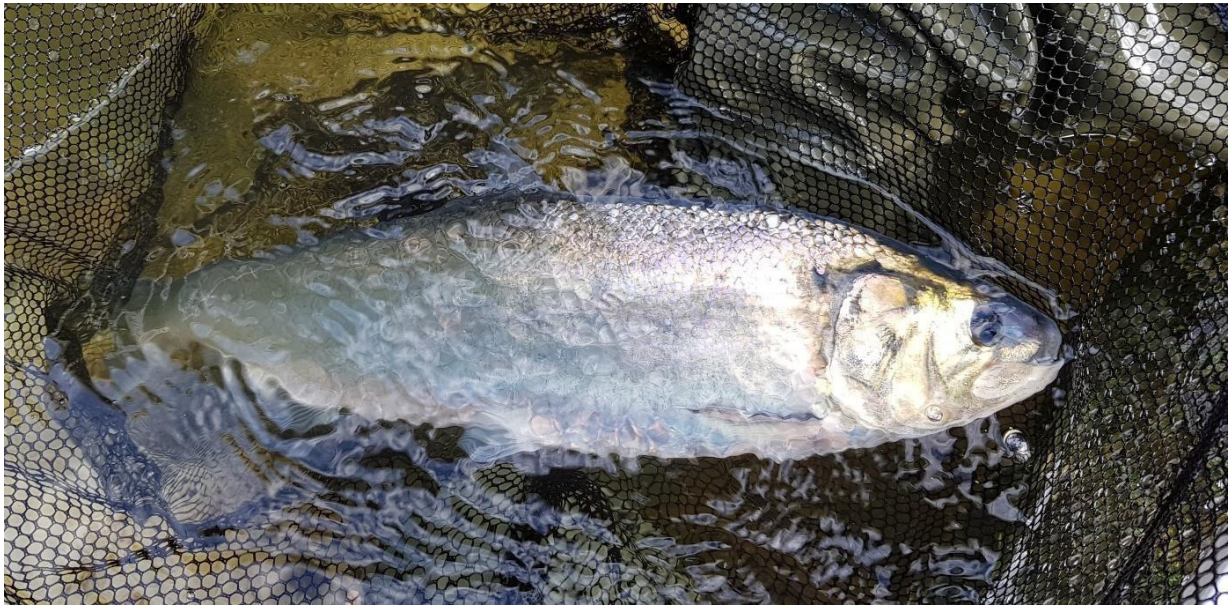
Figure 8. Alose vraie, Alosa alosa .