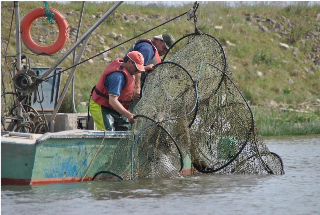
Figure 3. Pièges traditionnels de pêche à la lamproie marine (« botirão ») dans le fleuve Mondego.