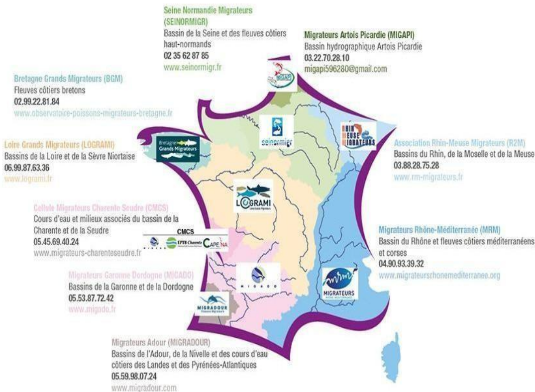
Figure 7. Carte des bassins hydrographiques français, des comités de gestion des poissons diadromes (COGEPOMI) correspondants et des associations de pêche à la ligne associées. La Corse constitue désormais un COGEPOMI distinct.