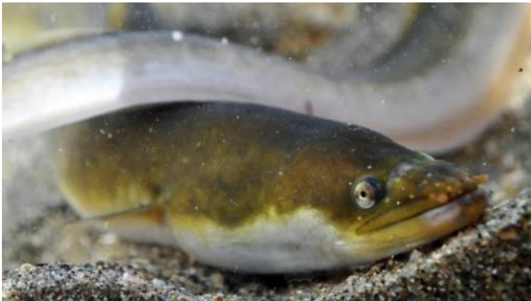
Figure 2. L'anguille européenne, Anguilla anguilla .