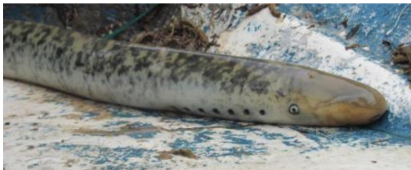
Figure 4. Lamproie marine, Petromyzon marinus .