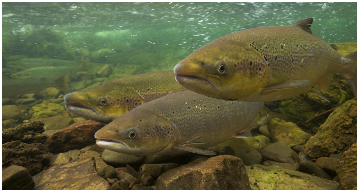
Figure 9. Saumon atlantique, Salmo salar .